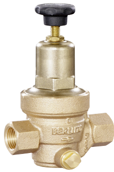
DRV 372 • DRV 378 Bauform A (DN 15 - DN 32)