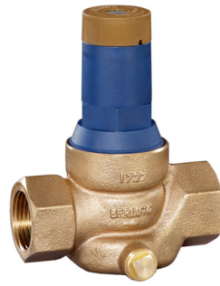
DRV 373 Bauform A (DN 15 - DN 32)