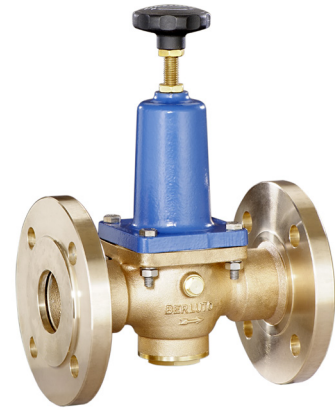
DRV 502 • DRV 508 Bauform B (DN 40 - DN 80)