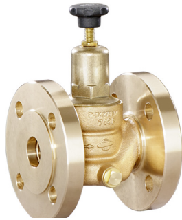
DRV 572 • DRV 578 Bauform A (DN 15 - DN 32)