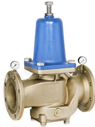
DRV 602 • DRV 608 DN 65 - DN 150